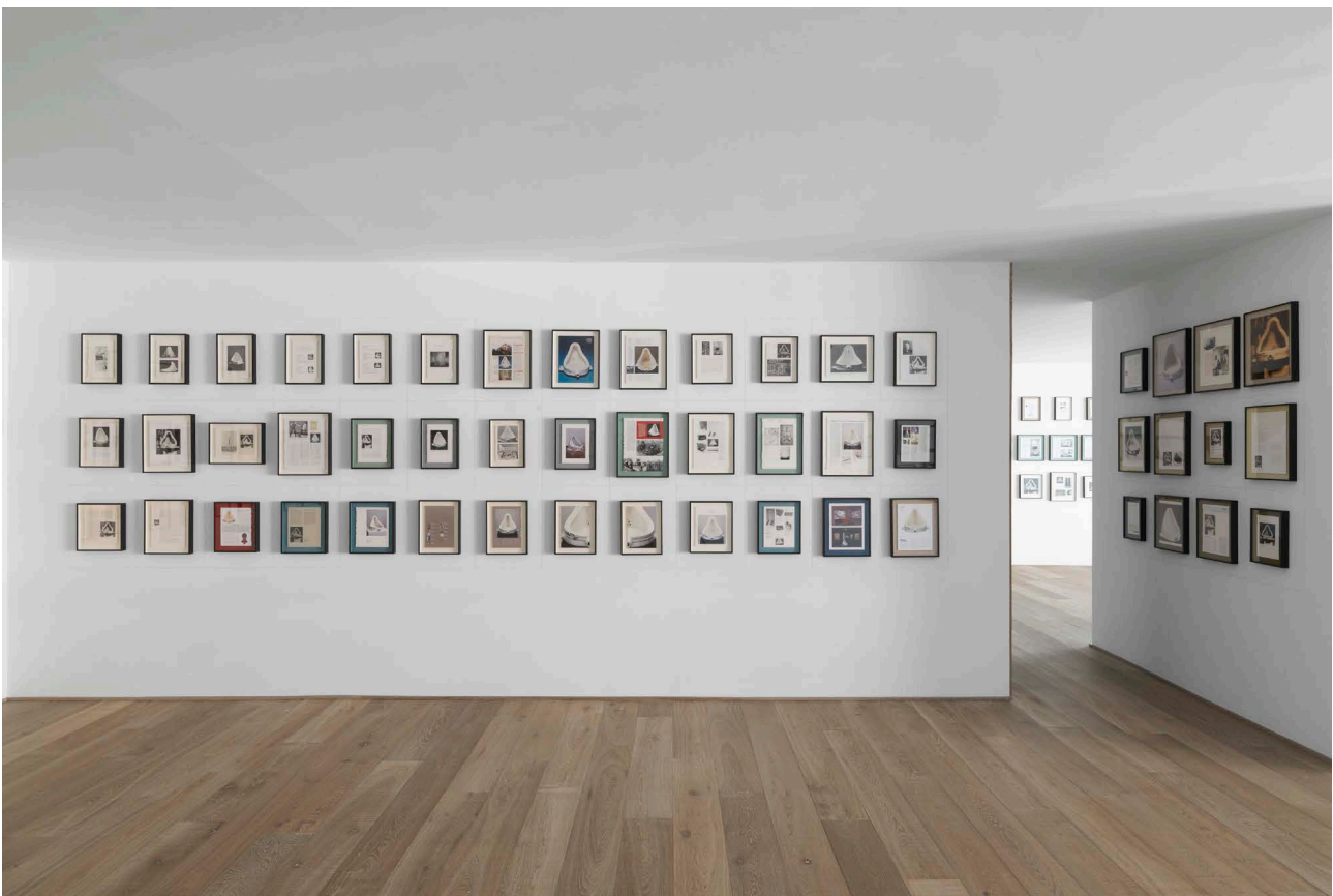
Exhibition views: Affiches & Fontaines , 2014 - Xavier Hufkens, Brussels.