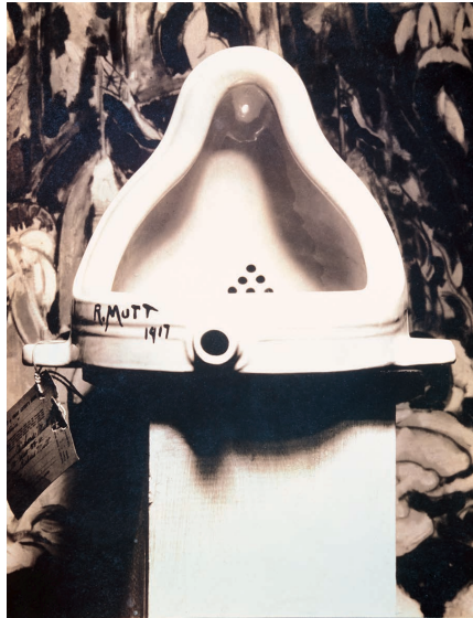
Fountain , 1917