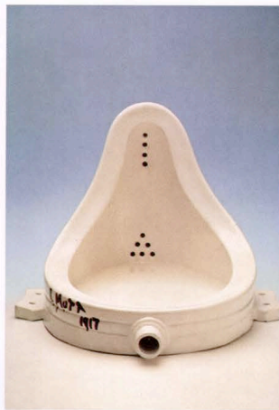
Marcel Duchamp, »Fountain«, ready made (nach dem verlorenen Original von 1917 / after the lost original from 1917)

Afif selbst ist der Strippenzieher im Hintergrund. Er lehnt es ab, öffentlich in Erscheinung zu treten oder durch Kameras gefilmt zu werden. Wie ein Regisseur dirigiert er aus dem OFF. VALENTINA VLASIC